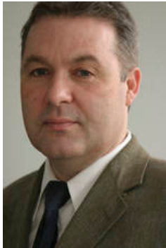
Das gesamte Orthopädie-Team der Seepark-Klinik

Für den bevorstehenden stationären Aufenthalt wünschen wir Ihnen alles Gute. Sollten Sie noch Fragen haben, stehen wir Ihnen gerne zur Verfügung.