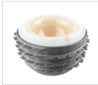
Abb. 3: BICON-PLUS

Wenn dann der Aufnahmetag gekommen ist, stehen eine ganze Reihe von Gesprächen und Untersuchungen an. Das ist auch der Grund dafür, warum wir Sie bitten, schon so früh zu erscheinen. Nach Erledigung der Aufnahmeformalitäten im Erdgeschoss wird eine Pflegekraft Ihrer Station mit Ihnen ein pflegerisches Erstgespräch führen. Hier fragen wir nach wichtigen Vorerkrankungen, Operationen, Ihren Medikamenten, evtl. Unverträglichkeiten und Allergien. Es wird eine Blutabnahme zur Bestimmung des Routinelabors erfolgen.