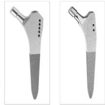
Abb. 4: SL-PLUS-Schaft mit Ti-HA beschichtet Abb. 5: SL-PLUS MIA